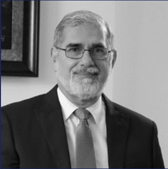
EC. ALBERTO DAHIK GARZOZI

Director del CESDE de la UEES, ex Ministro de Industrias, ex-Vicepresidente de la República.